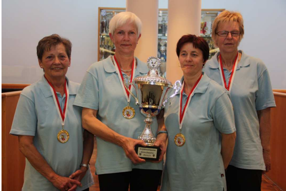
1. Platz Germania Weiden, Kreis Weiden, 1631 Kegel