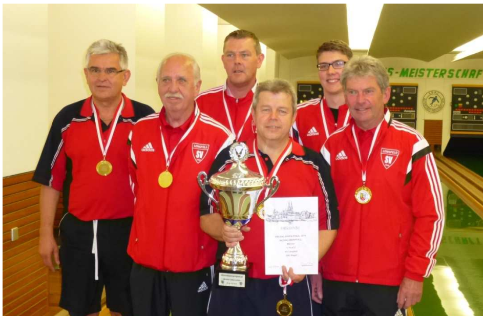
1. Platz SV Lengfeld, Kreis Kelheim, 2543 Kegel